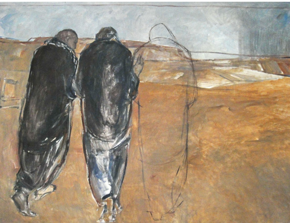
Zwei Jünger Jesu auf dem Weg nach Emmaus

Aus solchen Erzählungen könnte dann eine sehr besondere Ostergemeinschaft entstehen. Im Kleinen wie im Großen, in der Familie wie im Weltgeschehen. Vermutlich erwächst daraus auch ein ganz neuer Zugang zu den biblischen Texten, weil sie mit dem eigenen Leben und eigener Erfahrung angereichert werden.